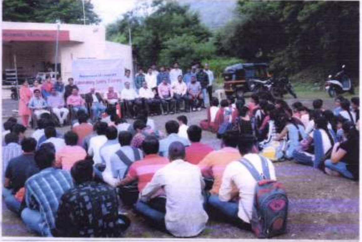
महविद्यालय, रसायनशास्त्र विभागान्तर्गत Laboratory Safety Training, workshop आयोजित.