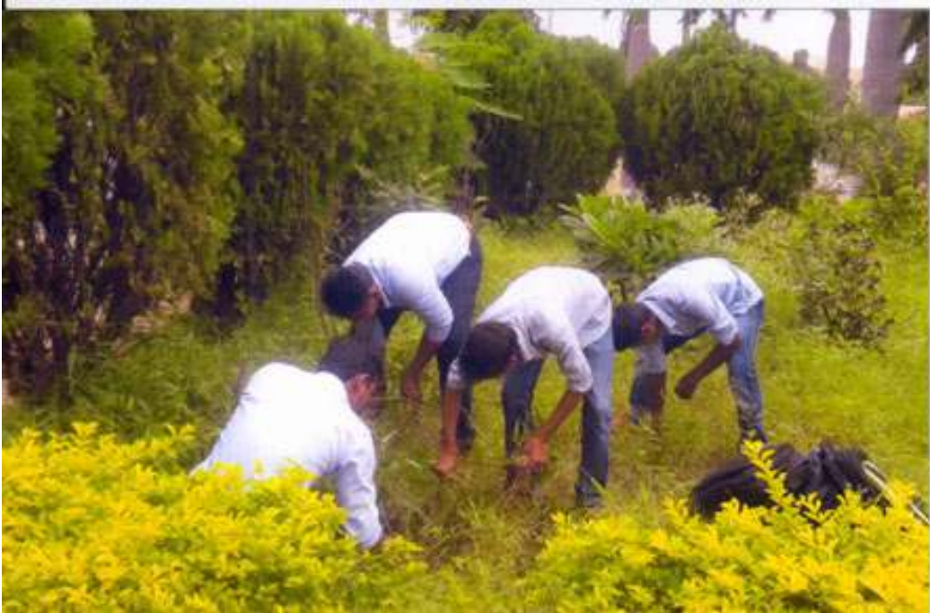
Students Participation in Swach Bharat Abhiyan