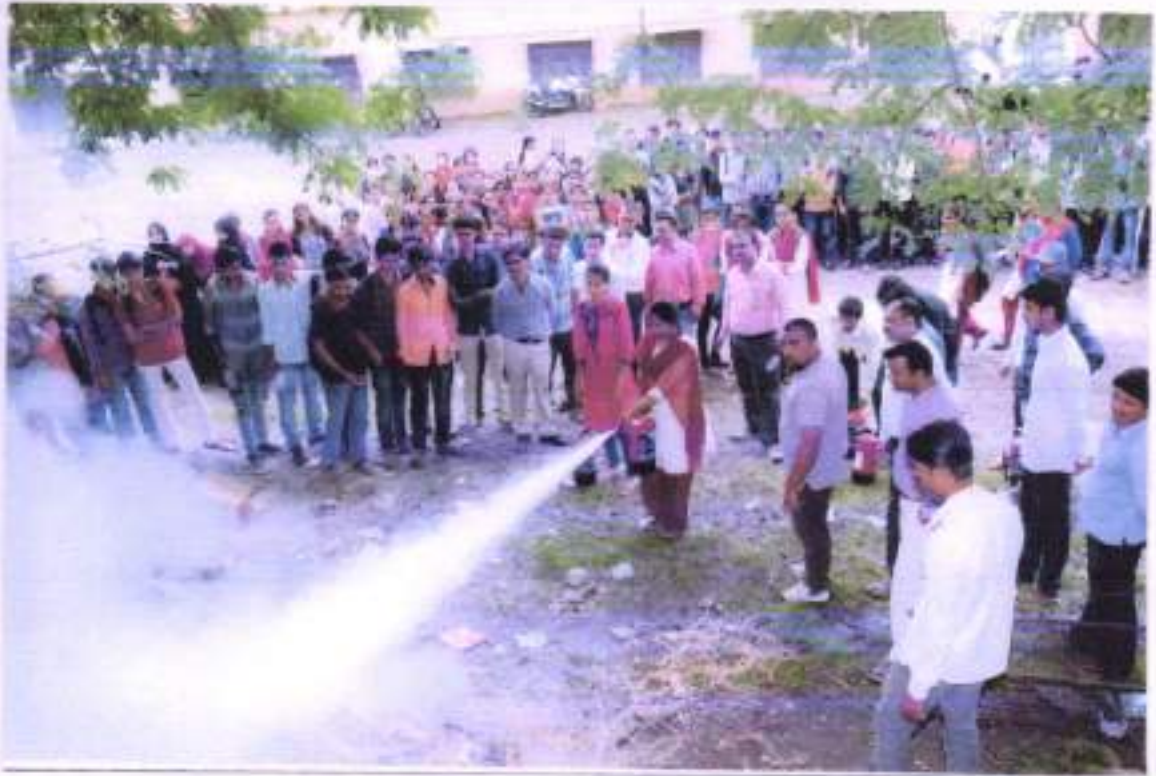
Laboratory Safety Training, workshop मध्ये प्रात्यक्षित करताना विद्यार्थी.