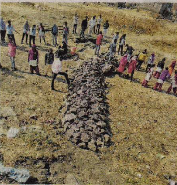
दगडी बंधारे तयार करताना राष्ट्रीय सेवा योजनेचे विद्यार्थी-विद्यार्थिनी.