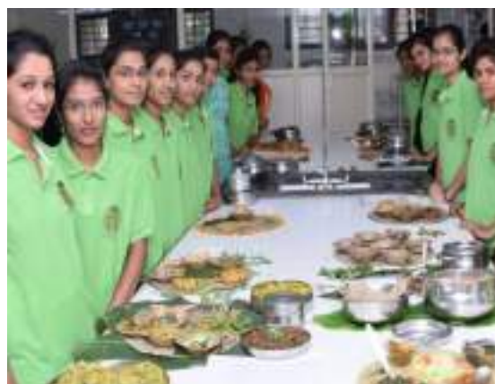
Participating students presenting various wild vegetable dishes and recipes