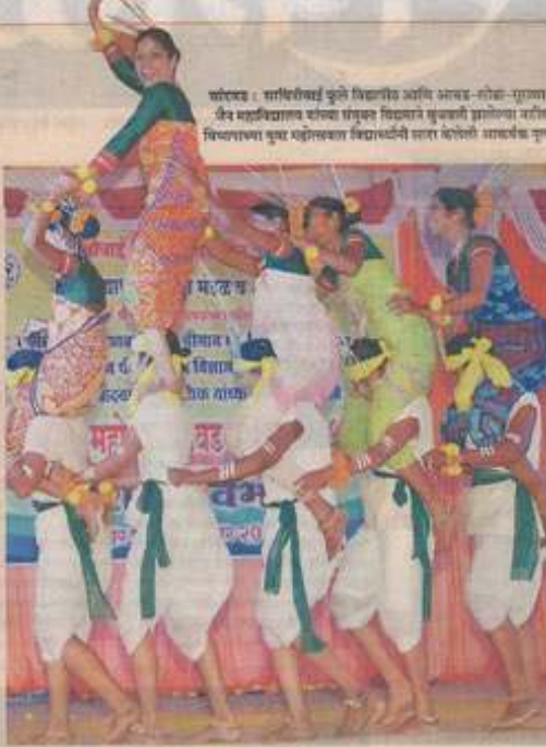
संक्रांतदाता | सवित्रीबाई फुले विश्वविद्यालय आणि आनंद-लोहा-सुरणा व जैन महाविद्यालय यांच्या संयुक्त विद्यमाने पुणे शहरातील विद्यार्थ्यांच्या युवा महोत्सवात विद्यार्थ्यांनी सादर केलेली आकर्षक नृत्य