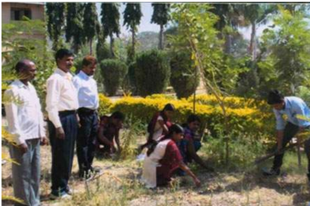
The students of Earn and Learn Scheme assist office and library staff in the routine work.

In the whole year college spent Rs. 1,24,650 on this scheme. Remuneration of every student was transferred in their accounts in Bank of Maharashtra, Chandwad.