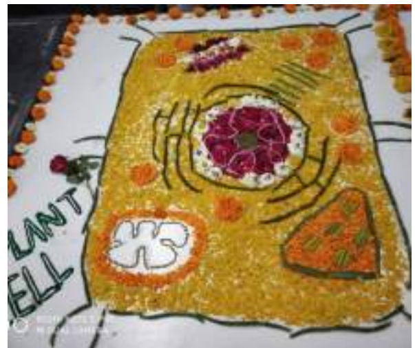
Flower Rangoli of Plant cell