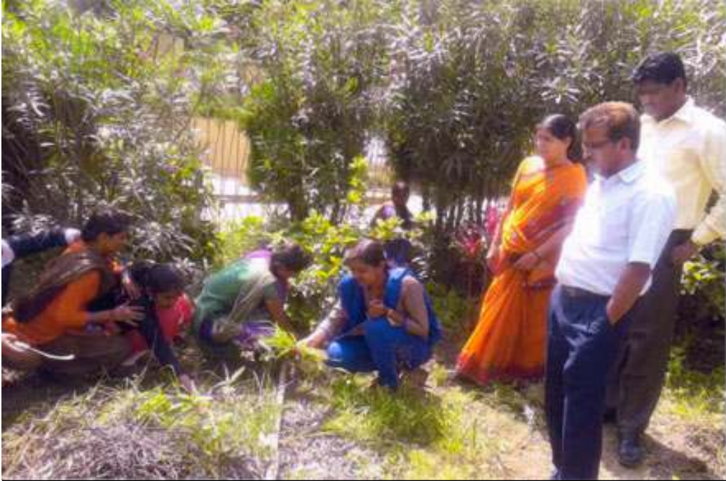
Students cleaning the College Campus under Swach Bharat Abhiyan