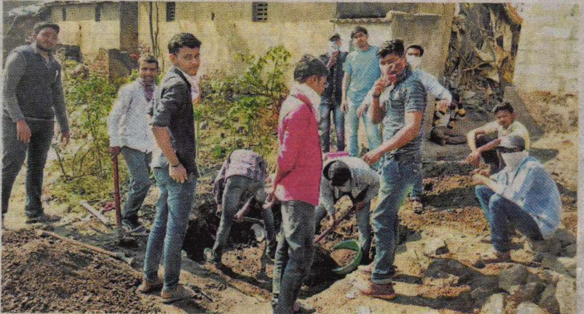
भोयेगाव येथे शोषखड्डे तयार करताना राष्ट्रीय सेवा योजनेचे विद्यार्थी.