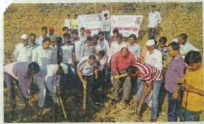
उर्ध्वळ : श्रमदान करताना नेमिनाथ जैन संस्थेच्या महाविद्यालयातील राष्ट्रीय सेवा योजनेचे विद्यार्थी.