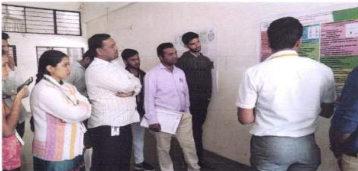
Expert with PG Student