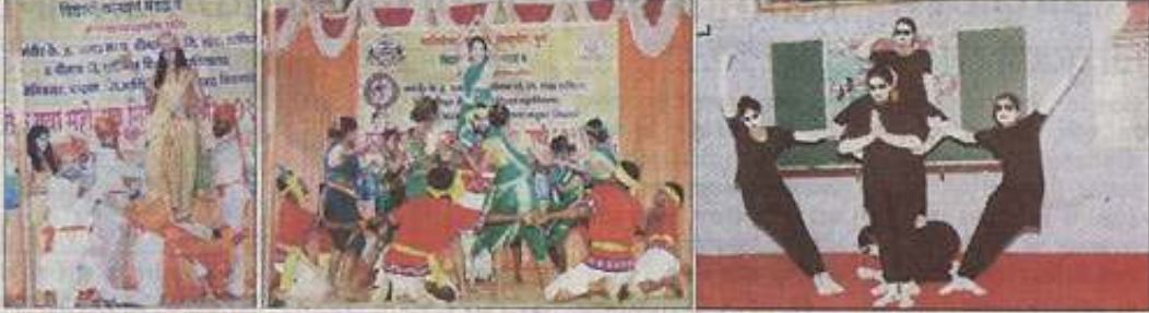
संक्रांतदाता | चांदवड

पुणे के सवित्रीबाई फुले विश्वविद्यालय व शहर के अक्षर-लोहा-सुरणा व जैन महाविद्यालय ने संयुक्त तत्वावधान में संघन हुए नाटिक विभागा के युवा महोत्सव में विद्यार्थियों ने आकर्षक नृत्य