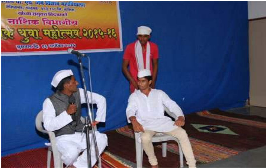
Students Performing in Yuvak Mahotsav (2015-16) Under Category Short Play