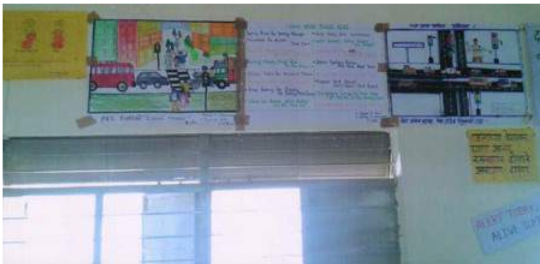
College has organized a poster presentation competition on road safety.