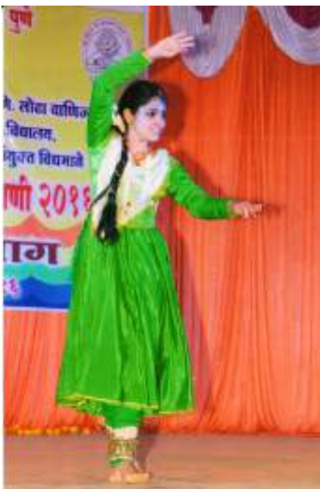
A girl student performing a Classical Dance in District Level Yuvak Mahotsav 2016-17