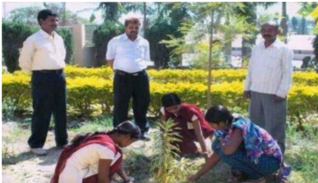
Students of Earn & Learn Scheme maintain the garden and the campus neat & clean.

Out of total expenditure Rs. 2,06,460 were spent on students of SC, ST, NT, SBC, OBC category and Rs. 87,840 were spent on students of Open category students.