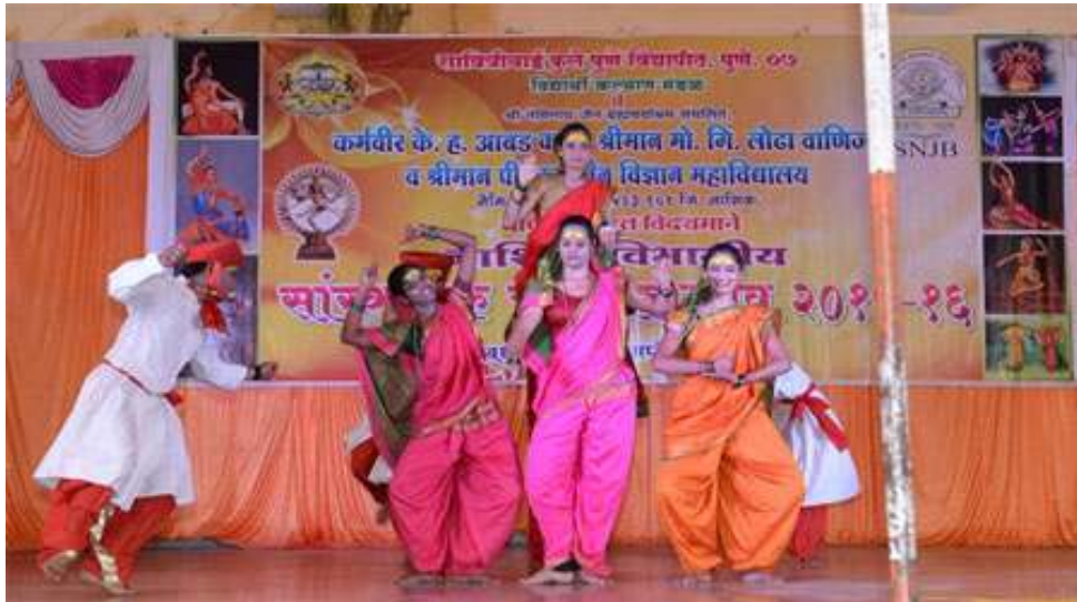
Students Performing in Yuvak Mahotsav Dance Competition 2015-16