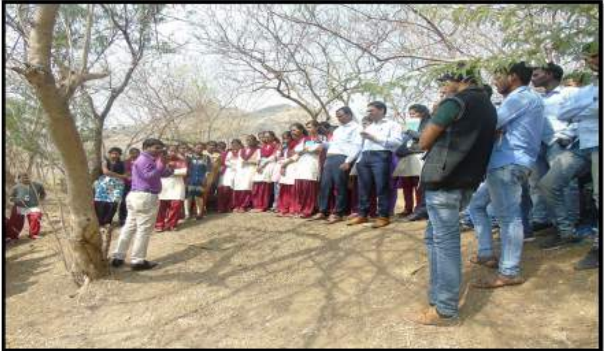
Application of GIS and GPS a field demonstration