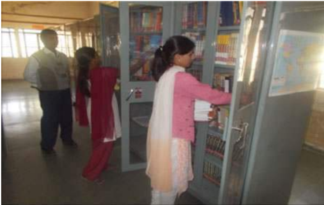
The students of Earn and Learn Scheme assist office and library staff in the routine work.

In the whole year college spent Rs.98580/- on this scheme. Remunerations were transferred into the accounts of students.