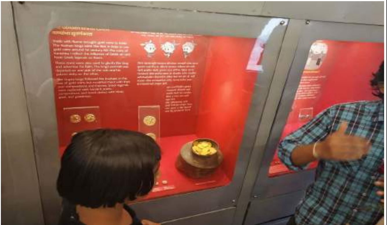
सोन्याची नाणी पाहताना विद्यार्थी व माहिती सांगताना संग्रहालय मार्गदर्शक