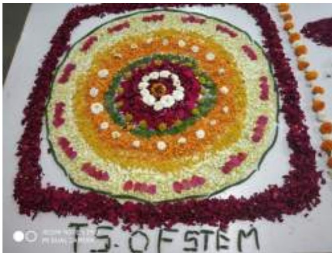
Rangoli T.S. of Stem by flower